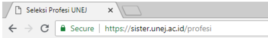
Gambar 1. Alamat Halaman Pada Web Browser